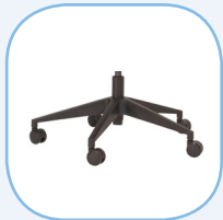
Zwarte kunststof voetkruis

“Bekijk onze complete bureaustoelen collectie hier: www.schaffenburg.nl .”