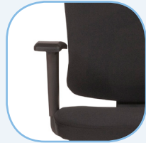
In breedte en hoogte verstelbare armleuningen