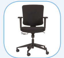
Geschikt voor langer dan 5 uur gebruik