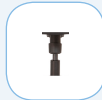
Gasveer klasse 4