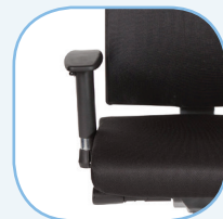
Verstelbare 3D armsteunen