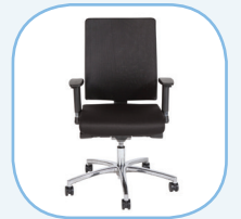
Geschikt voor langer dan 5 uur gebruik