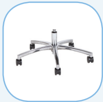
Staal aluminium gepolijst voetkruis

“Bekijk onze complete gecertificeerde stoelen hier: www.schaffenburg.nl !”